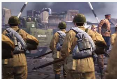
Рис. 1. Скриншот из игры Company of Heroes 2